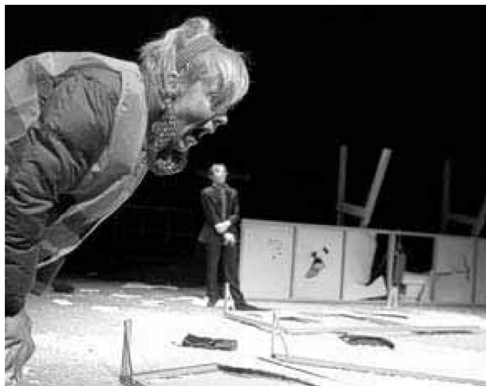
Een scene uit Het geheven vingertje door theatergroep Max.